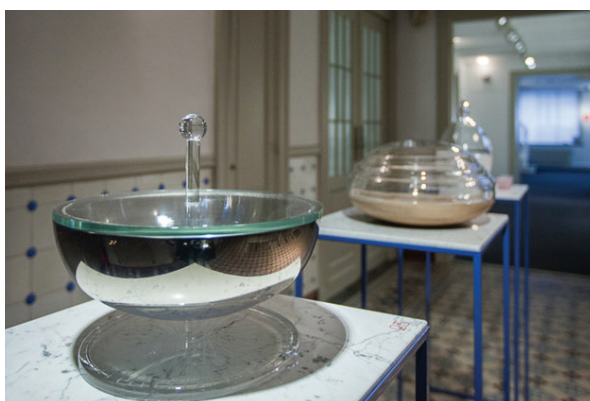
Prague UMPRUM in Brussels, Design September, Brusel