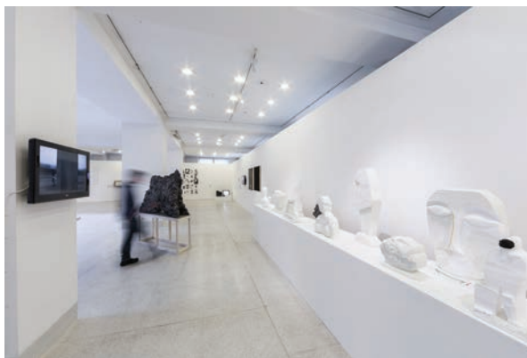
Výroční výstava UMPRUM 2013, Veletřní palác Národní galerie v Praze