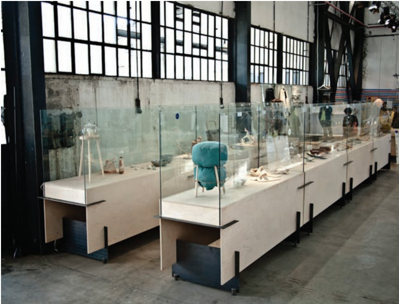
Point of View, Salone Internazionale del Mobile, Milán