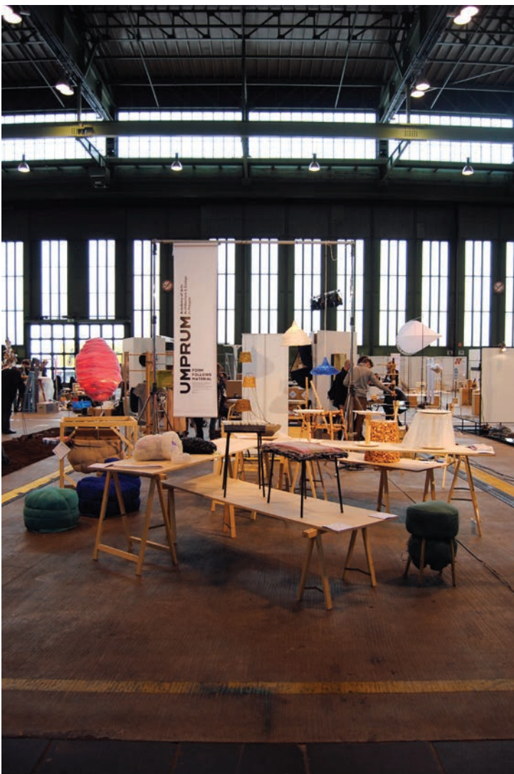
DMY – International Design Festival, Berlín