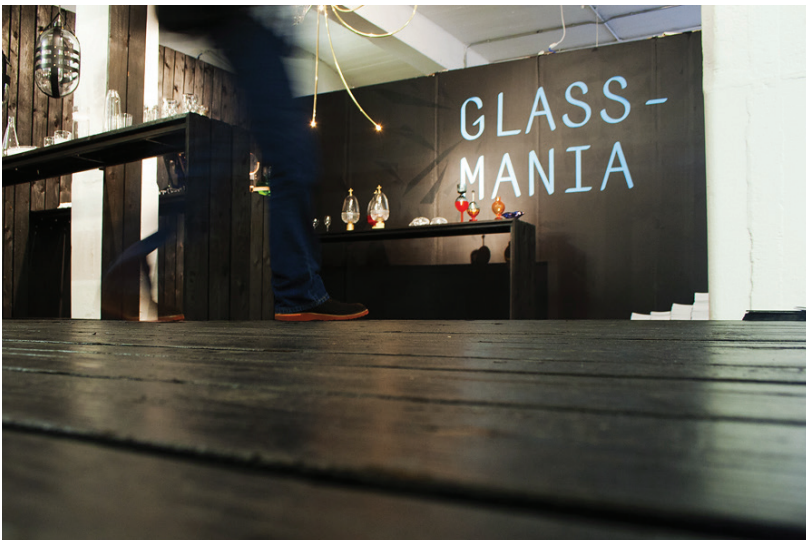
Glassmania, London Design Week, Londón